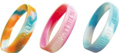
マーブルビビット