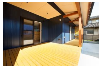
視線の抜けを意識した広々ウッドデッキ

日本においてミニマルな暮らしが広がる中で、住まいにも影響がおきています。2023年の住まいトレンド「平屋回帰」は戦前までの日本人の暮らし方であった「コンパクトな」平屋が見直され、需要が増加していることが象徴されたキーワードです。かつて日本では、多くの人は平屋や一階建ての長屋に住んでおり、二階建て以上の家が普及したのは戦後。日本の伝統的な家の形に、今あらためて注目が集まっています。アメリカではすでに2015年頃から「小さな家で無駄なく豊かに暮らす」ライフスタイルが流行しています。